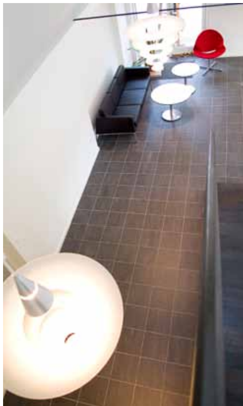
Gangen kan bruges til fx udstillinger