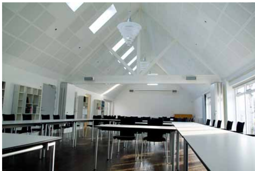
Sogneårdens "storstue" er 18,1 meter lang og 7,3 meter bred. Der er plads til 110 personer til foredrag og cirka 90 personer til kaffe eller spisning. De fleste AV-faciliteter er tilgængelige.